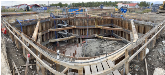
Pumpstation P1 i Kristianstad under utförandefasen.

Vid djupa schakter i mjuka jordar används idag avancerade datormodeller för att förutse hur mark och konstruktioner påverkas under byggskedet.